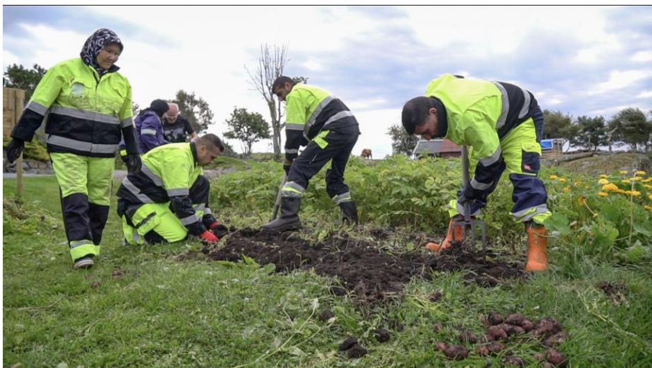
Frå språktrening og integreringstiltak på Gullvegen gardstun, Bømlo

Det er ikkje gjort systematisk kartlegging, sidan prosjektet skulle ha med kommunar med lite eller ingen Inn på tunet-aktivitet. Det tek tid å byggje opp eit tilbod, både for kommunane og for bonden.