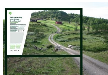
Innsyn i terrenget